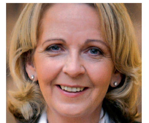
Herausforderin: Hannelore Kraft will im Frühjahr 2010 als SPD-Spitzenkandidatin gegen Jürgen Rüttgers antreten.