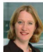
Kerstin Andreae, MdB ist die Sprecherin für Wirtschaftspolitik der Bundestagsfraktion Bündnis 90/Die Grünen.

Im Ergebnis ergibt sich durch die Abschaffung der Lohnsteuerklassen III, IV und V für jede steuerpflichtige Person je nach Einkommenshöhe ein realistischeres Nettoeinkommen, was in vielen Fällen zu einer günstigeren Berechnungsgrundlage für das Elterngeld und im Fall von Arbeitslosigkeit beim Arbeitslosengeld I führen wird. Die rechtzeitige Wahl der Lohnsteuerklasse kann nicht mehr verpasst werden.