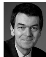
Jörg Schönenborn ist Chefredakteur Fernsehen beim WDR und ARD-Wahllexperte.

Ein Jahr vor der nächsten Bundestagswahl ist damit die Ausgangssituation klar beschrieben. Setzen sich die Entwicklungslinien der letzten Jahre fort, dürfte sich innerhalb des Bundestags das Gewicht weiter von den großen zu den kleinen Parteien verschieben und damit auch künftig die Bildung einer Zwei-Parteien-Koalition mit ausreichender Mehrheit unwahrscheinlich machen – mit Ausnahme der großen Koalition. Während die kleinen Parteien auch unter veränderten Bedingungen ihre Stammwähler/innen binden können – bei Grünen und FDP aus inhaltlichen Gründen, bei der Linken aus Protest oder als ostdeutsche Regionalpartei – erfüllen Union und SPD nicht die Erwartungen, die sich aus der beschriebenen gesellschaftlichen Stimmungslage ergeben. Schlimmer noch: sie erwecken oft und gern den Eindruck, die Stimmung so gar nicht wahrzunehmen und verklären miserable Wahlergebnisse deshalb regelmäßig als Erfolg. Weder die Botschaft der Bundeskanzlerin aus dem Sommer, der Aufschwung sei bei den Menschen angekommen, noch die unverhohlene Freude des SPD-Kanzlerkandidaten über das Debakel der CSU am Wahlabend sind geeignet, an dieser Situation etwas zu ändern. Am Anfang, so der Eindruck, müsste die Erkenntnis stehen, die ungeschminkte Anerkennung der Realität.